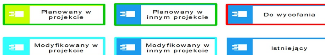
Diagram komponentów Mediateka Muzyki Polskiej